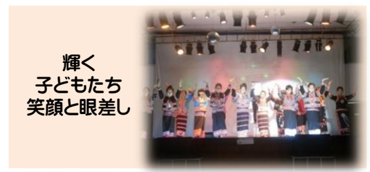
輝く 子どもたち 笑顔と眼差し