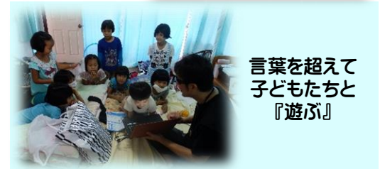
言葉を超えて 子どもたちと 『遊ぶ』