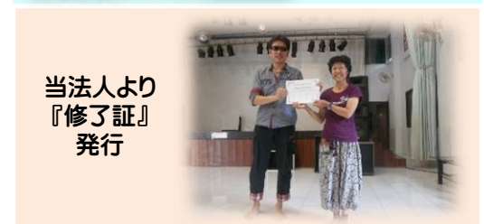
当法人より 『修了証』 発行

【問合せ】NPO法人シニアライフセラピー研究所 藤沢市鵜沼海岸7-20-21「亀吉」